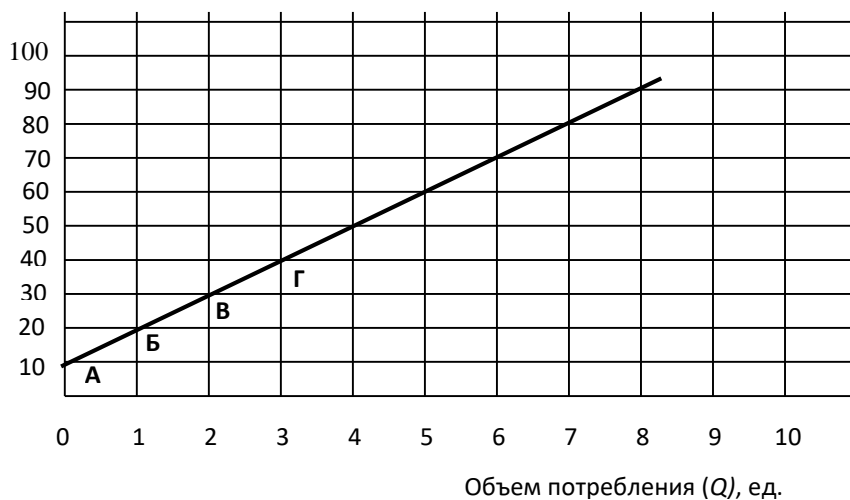
Рис. 1.2. Прямая зависимость между величиной дохода и объемами потребления благ

Линия на рисунке показывает следующие изменения зависимостей: