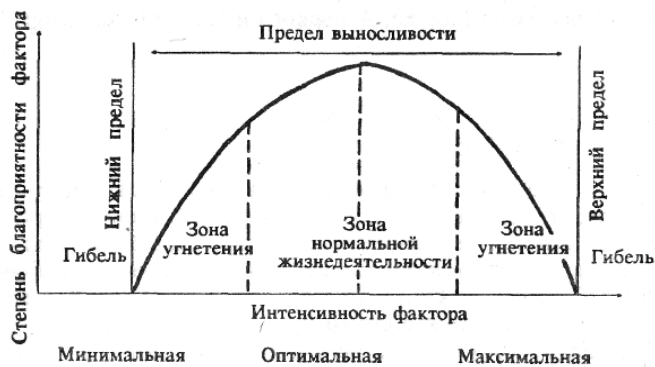
Рис. 95. Схема действия экологического фактора

При значительных отклонениях от оптимума как в сторону повышения, так и в сторону понижения жизнедеятельность организмов угнетается. Максимальное и минимальное значения фактора, при которых еще возможна жизнедеятельность, называются пределами выносливости (границы терпимости).