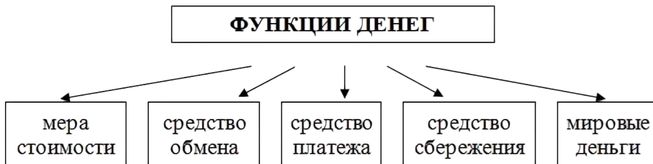
- Рисунок 1 – Функции денег

Сущность денег как экономической категории проявляется в их функциях, которые выражают внутреннюю основу содержания денег. Деньги выполняют следующие пять функций :