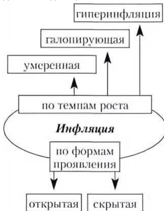
- Рисунок 2 – Виды инфляции

- гиперинфляция – свыше 100 % в год – сочетается с экономическим кризисом, из оборота уходит мелкая денежная единица.