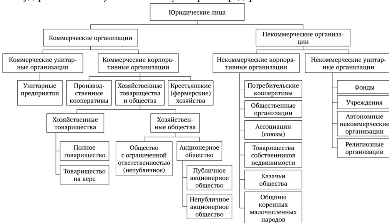
Рис.1 Организационно-правовые формы организаций

Хозяйственные товарищества - представляет собой объединение субъектов права, которые несут ответственность за исключением вкладчиков по обязательствам товарищества всем своим имуществом. Требования к формированию уставного капитала не предъявляются. В товариществах дела ведут сами участники, органов управления не создается.