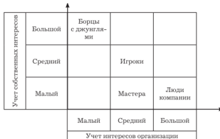
Рис. 4. Возможный (предположительный) вариант двухмерной интерпретации классификации стилей Г. Щекина

Достоинства: в основе – простая и ясная концепция, задействовано только два фактора, но, в отличие от “решетки” Блейк-Моутон и классификации Реддина, включен новый автономный фактор, сочетаемый с независимыми факторами ранее названных классификаций.