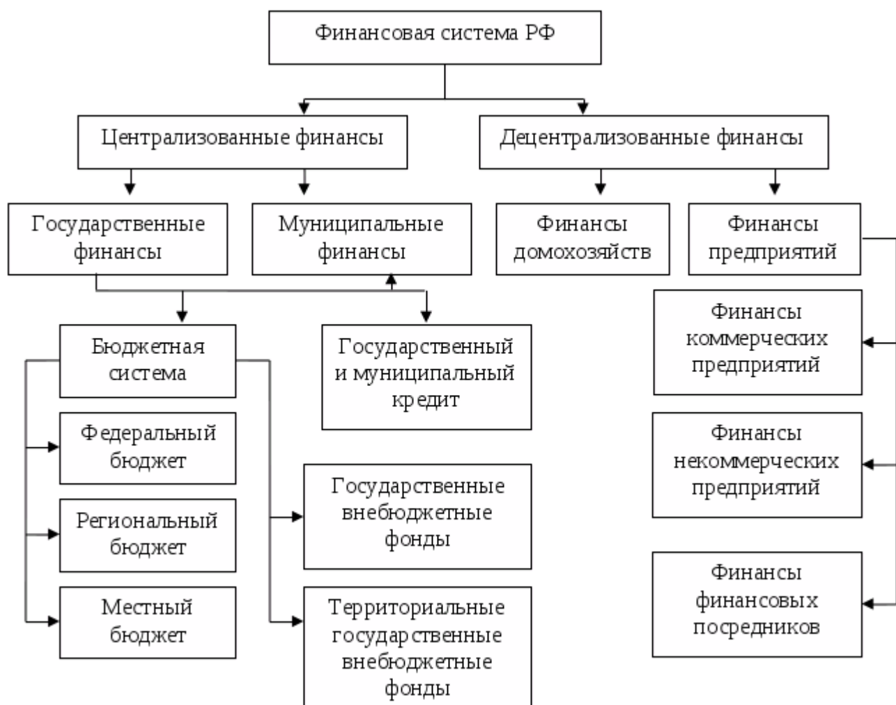
- Рисунок 3 – Финансовая система РФ

Таким образом, централизованные финансы используются для регулирования экономики и социальных отношений на макроуровне, а децентрализованные – финансы хозяйствующих субъектов, используемые для обеспечения воспроизводственного процесса денежными средствами на микроуровне.