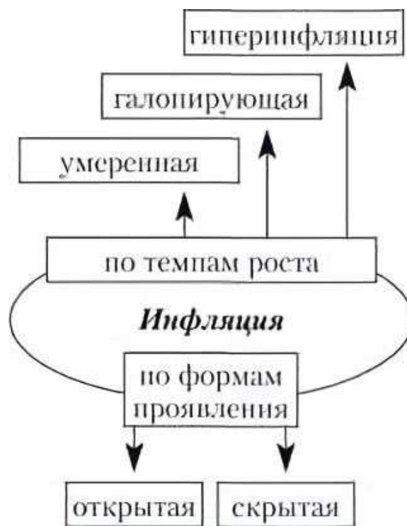
- Рисунок 2 – Виды инфляции

Денежная реформа (проводиться однократно) – полное или частичное преобразование денежной системы, проводимое государством с целью упорядочения и укрепления денежного обращения.