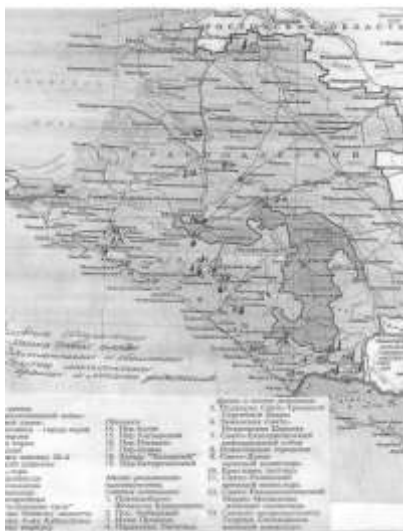
Рисунок 1 – Пример выполнения карты (объекты туристского показа)

Характеристика ресурсов края нанесение объектов туристского, экскурсионного показа на контурные карты: природные, культурно-исторические, социально-экономические (Рис. 1). Применение знаний в составлении конкретных маршрутов. Методические рекомендации: карты могут быть выполнены в бумажном варианте посредством ручного нанесения информации либо в электронном варианте с использованием как специализированных программ ГИС, ГПС, так и Paint – растрового графического редактора компании Microsoft, входящий в состав всех операционных систем Windows.