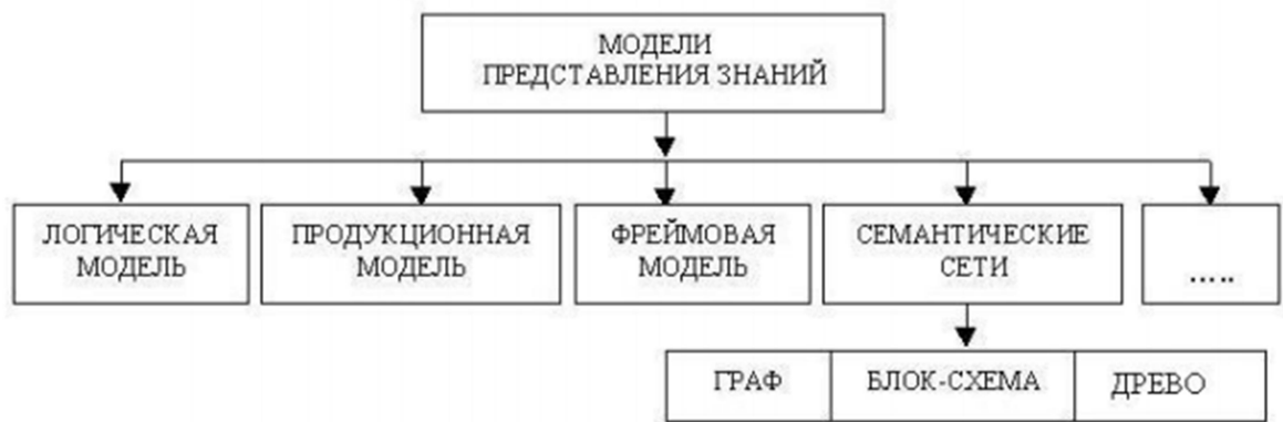
Рис. Модели представления знаний

Использование семантических сетей позволяет изменить взгляд на сами принципы изложения учебной информации – становится возможным активный зрительный анализ структуры учебного материала. При этом объем текстовой информации уменьшается, опускается большинство из промежуточных логических операций, тщательные и подробные выкладки заменяются образами. Представление факта становится возможным провести визуально без подробного текстового описания.