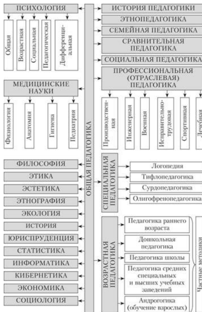
Рисунок 2 – Связь педагогики с другими науками

Как наука, дошкольная педагогика имеет общую, специальную и частную методологию: