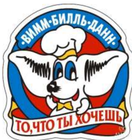
Рис. 5. Логотип компании «Вимм-Биль-Данн»