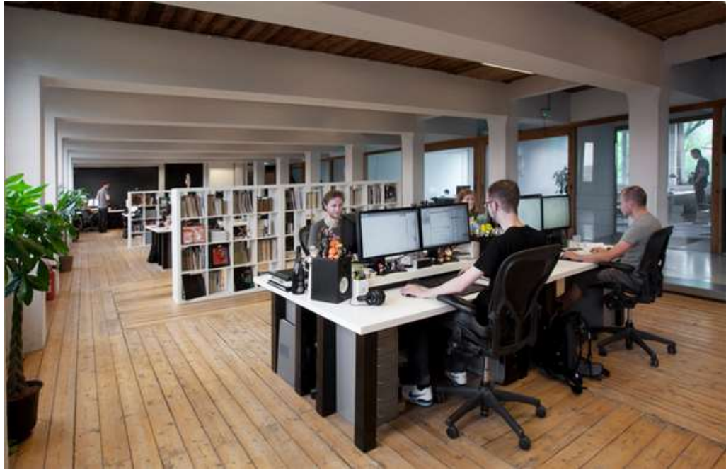
Рис. 10. Офисное пространство.