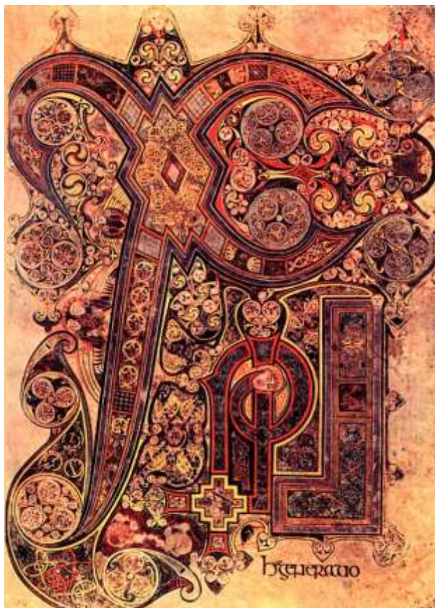
Рис. 1. Инициал из Келлской книги.