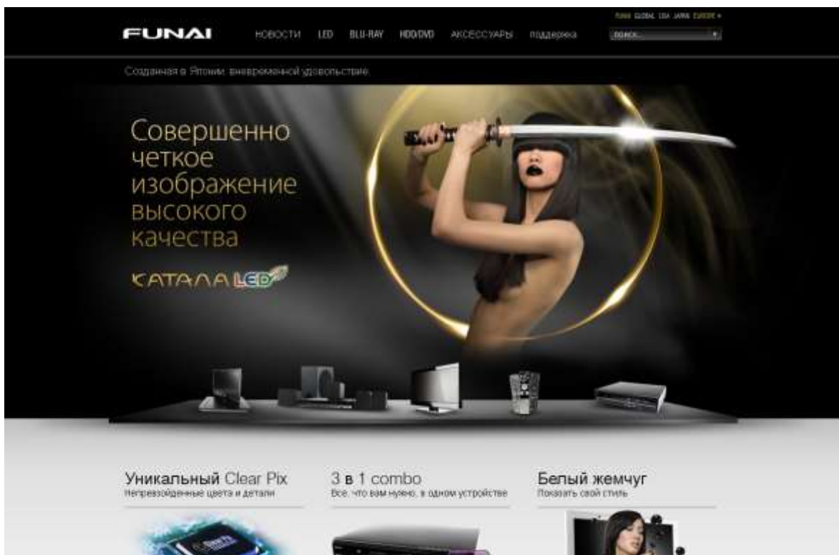
Рис. 6. Дизайн сайта компании «Фунай».