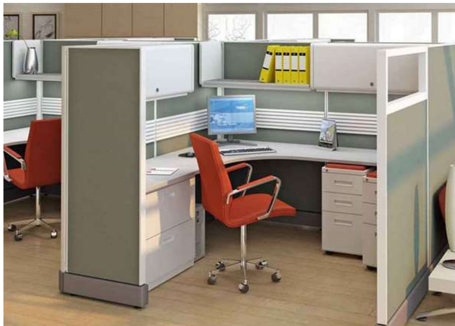
Рис. 11. Офисное пространство.