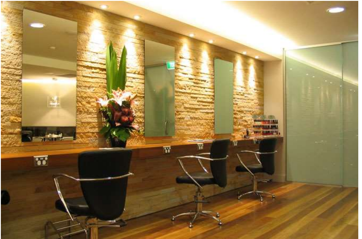
Рис. 8. Дизайн интерьера Парикмахерской.