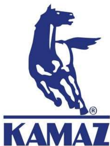
Рис. 4. Логотип автомобильной корпорации «КАМАЗ»