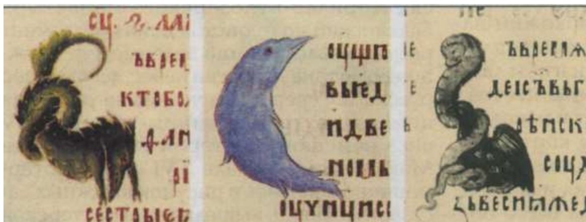
Рис. 2. Заглавные буквы книги из мастерской Андрея Рублёва.