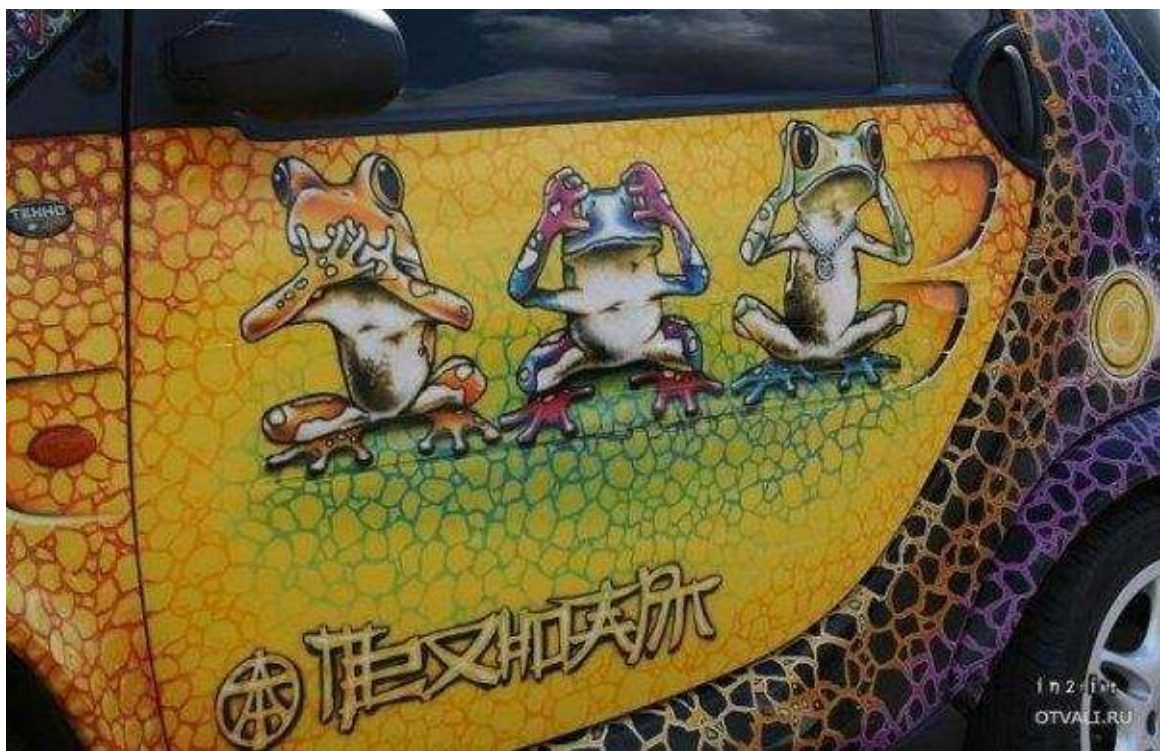
Рис. 7. Автоаэрография.