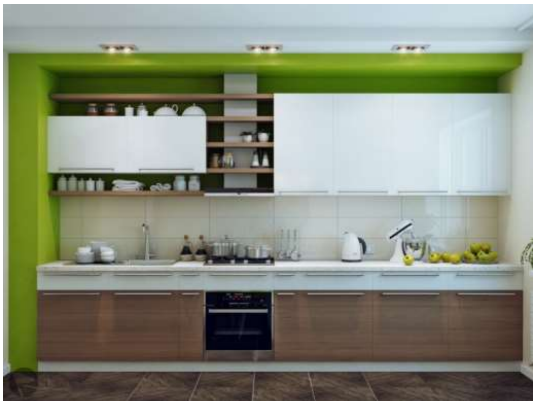
Рис. 9. Дизайн интерьера кухни.