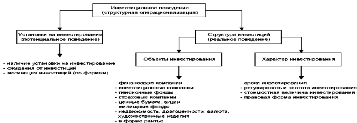
Рис. 2 – Пример схемы структуры понятия