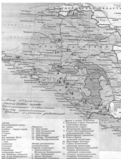
Рисунок 1 – Пример выполнения карты (объекты туристского показа)