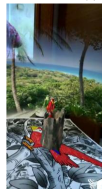
Рисунок 1 - Образец объемного изображения, полученного в приложении Quiver

Открыть браузер (Chrome, Opera или другой).