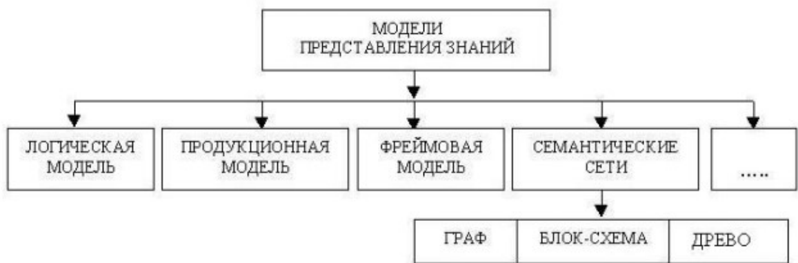
Рис. Модели представления знаний

Использование семантических сетей позволяет изменить взгляд на сами принципы изложения учебной информации – становится возможным активный зрительный анализ структуры учебного материала. При этом объем текстовой информации уменьшается, опускается большинство из промежуточных логических операций, тщательные и подробные выкладки заменяются образами. Представление факта становится возможным провести визуально без подробного текстового описания.