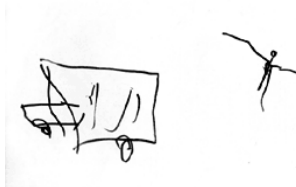
Рисунок 4. Сережа, 2 г. 10 мес. Машина и человек

72. Выберите верный ответ. Пример какой стадии развития детского изобразительного творчества приведен на рисунке 4.