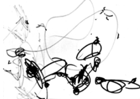
Рисунок 1. Катя, 1 г. 9 мес.

69. Выберите верный ответ. Пример какой стадии развития детского изобразительного творчества приведен на рисунке 1.