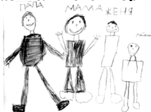
Рисунок 2. Женя, 6 лет 6 мес. Рисунок семьи

70. Выберите верный ответ. Пример какой стадии развития детского изобразительного творчества приведен на рисунке 2.