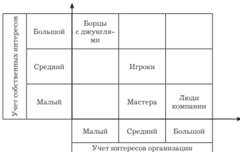
Рис. 4. Возможный (предположительный) вариант двухмерной интерпретации классификации стилей Г. Щекина

Достоинства: в основе – простая и ясная концепция, задействовано только два фактора, но, в отличие от “решетки” Блейк-Моутон и классификации Реддина, включен новый автономный фактор, сочетаемый с независимыми факторами ранее названных классификаций.