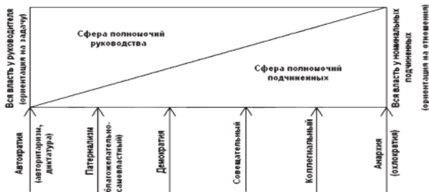
Рис.1. Одномерная классификация стилей руководства по соотношению объема власти у субъекта - объектов

Недостатки: предназначена для характеристики свойства (ориентации) личности, а отталкивается от объема власти в организации; не обладает идентификационными свойствами (не ориентирована на идентификацию) поскольку объем власти в организации никогда неизвестен.