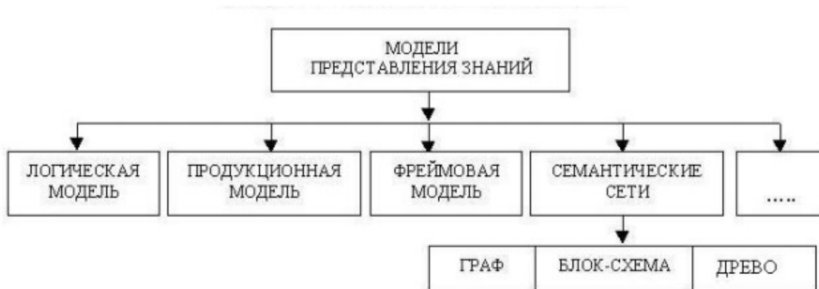
Рис. Модели представления знаний

Использование семантических сетей позволяет изменить взгляд на сами принципы изложения учебной информации – становится возможным активный зрительный анализ структуры учебного материала. При этом объем текстовой информации уменьшается, опускается большинство из промежуточных логических операций, тщательные и подробные выкладки заменяются образами. Представление факта становится возможным провести визуально без подробного текстового описания.