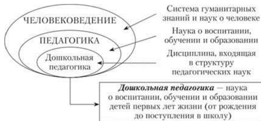
Рисунок 1 – Дошкольная педагогика как отрасль общей педагогики

Дошкольная педагогика имеет свои объект и предмет исследования, отличные от объекта и предмета других наук, перечисленных на рис. 2. В то же время и дошкольная педагогика, и все эти науки касаются проблем развития детей дошкольного возраста.