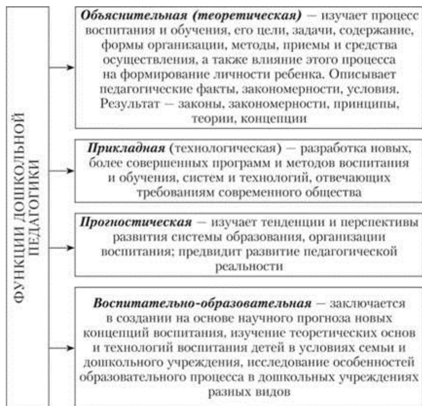
Рисунок 3 – Функции дошкольной педагогики как науки

В соответствии с общей, специальной и частной методологиями дошкольной педагогики определяются ее основные категории как науки, характеризующие следующее: