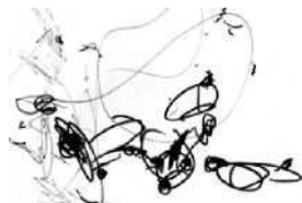
Рисунок 1. Катя, 1 г. 9 мес.

4. Выберите верный ответ. Пример какой стадии развития детского изобразительного творчества приведен на рисунке 1.