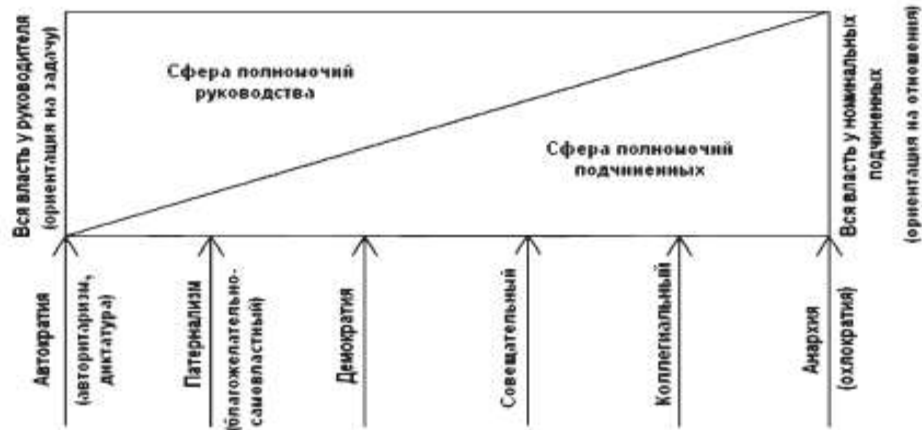
Рис.1. Одномерная классификация стилей руководства по соотношению объема власти у субъекта - объектов

Недостатки: предназначена для характеристики свойства (ориентации) личности, а отталкивается от объема власти в организации; не обладает идентификационными свойствами (не ориентирована на идентификацию) поскольку объем власти в организации никогда неизвестен.