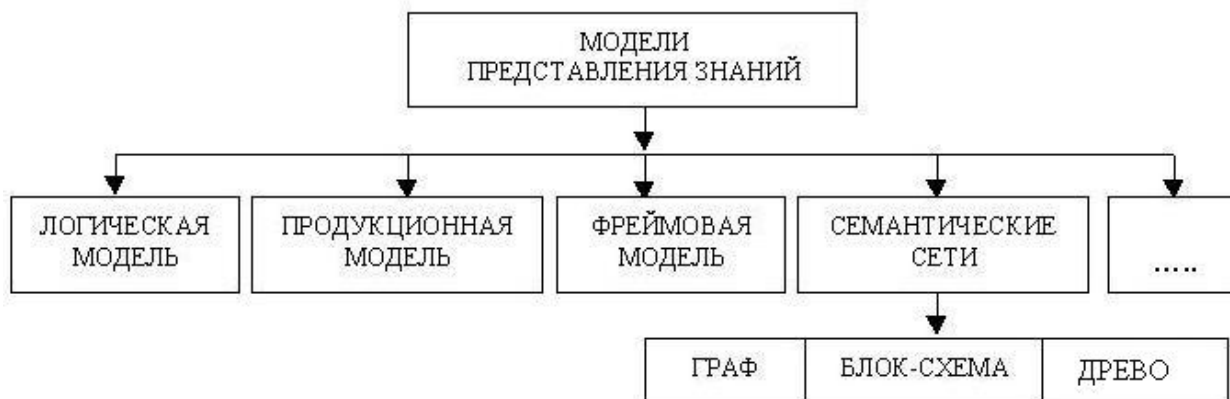
Рис. Модели представления знаний

Использование семантических сетей позволяет изменить взгляд на сами принципы изложения учебной информации – становится возможным активный зрительный анализ структуры учебного материала. При этом объем текстовой информации уменьшается, опускается большинство из промежуточных логических операций, тщательные и подробные выкладки заменяются образами. Представление факта становится возможным провести визуально без подробного текстового описания.